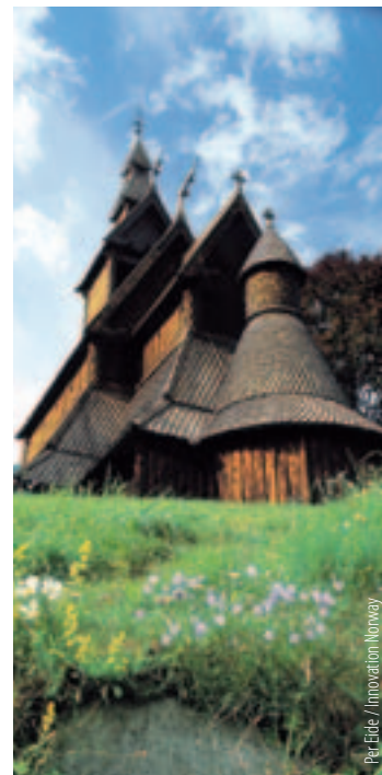
Per Eide / Innovation Norway

Frühstück an Bord. Ankunft in Frederikshavn (Dänemark) gegen 7.30 Uhr. Heimreise über Ålborg – Flensburg in die Zustiegsorte.